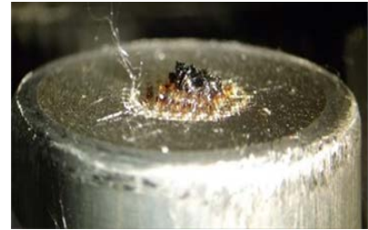
Figure 3 : Pastille défectueuse Fibres fondues et extrudées. Ne pas utiliser. Remplacer la pastille.