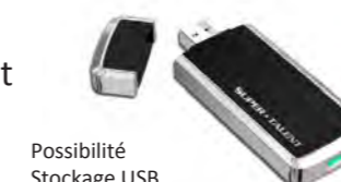
Possibilité Stockage USB

Une conception compacte Une énergie efficace et fiable Avec une batterie performante, et un faible bruit rendre le Padscan HD 3 respectueux de l'environnement