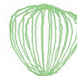
Visualisation en 3D de la vessie