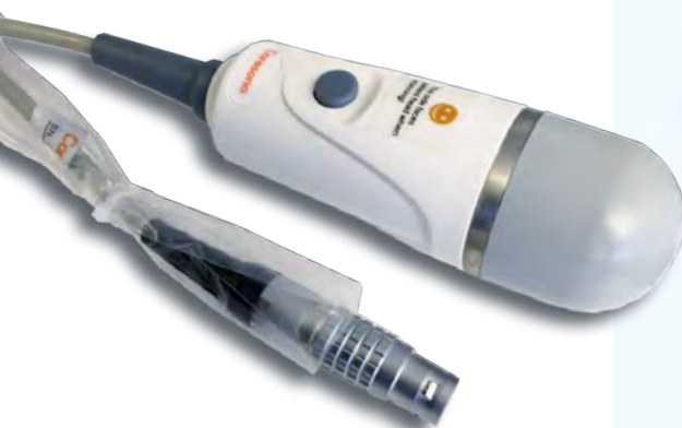
Conception mécanique brevetée de la sonde