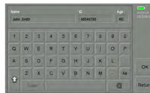
Clavier alphanumérique avec touches accentuées

Fréquences optimales pour les enfants et pour les adultes pré-réglées La nouvelle sonde 3D vous permet de numériser en temps réel et d'obtenir des résultats fiables de la production d'urine en quelques secondes.