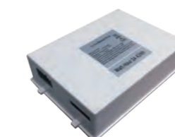
Batterie Li-ion pour 3 heures de balayage et 8 heures en veille