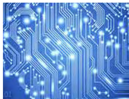
Volume extrêmement précis grâce à un algorithme breveté