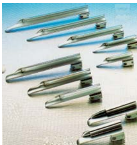
Lames à fibre optique MILLER