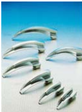
Lames à fibre optique MAC INTOSH